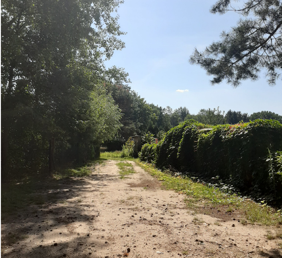
Abb.3 Zufahrt zu Lauben und Garagen