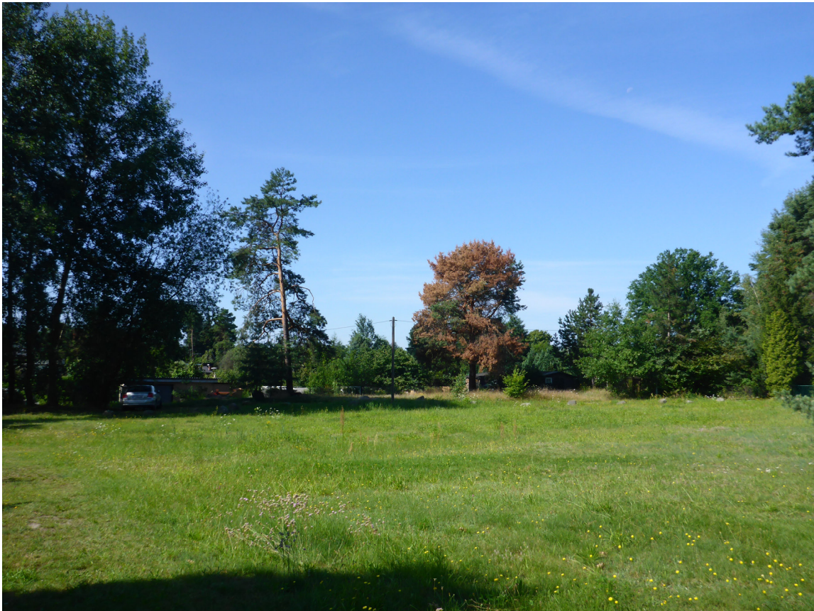
Abb.2 Blick auf die unbebaute nördliche Grundstücksfläche in Richtung Schulze-Delitzsch-Str.