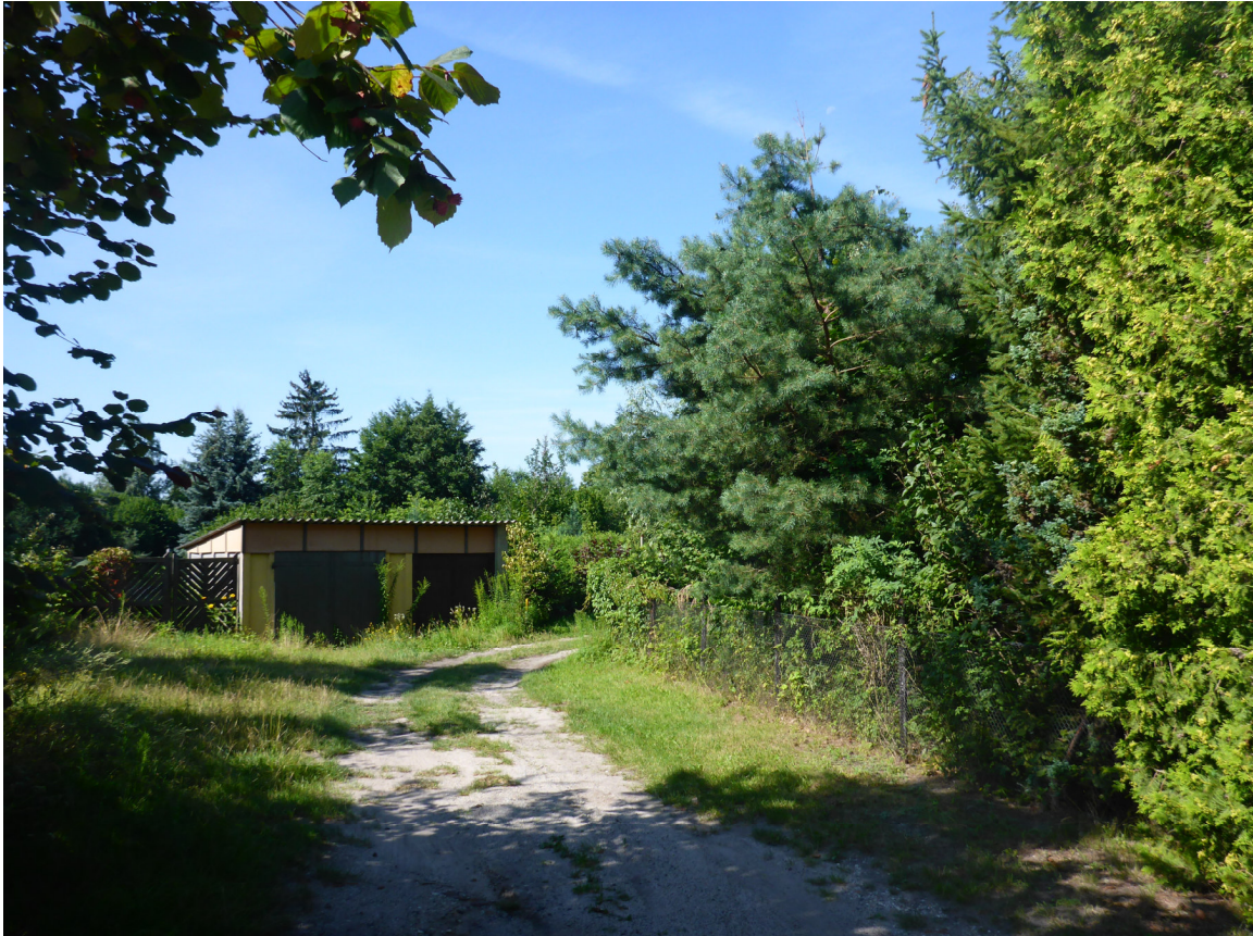
Abb.5 Fläche südlich der Schulze-Delitzsch-Str.