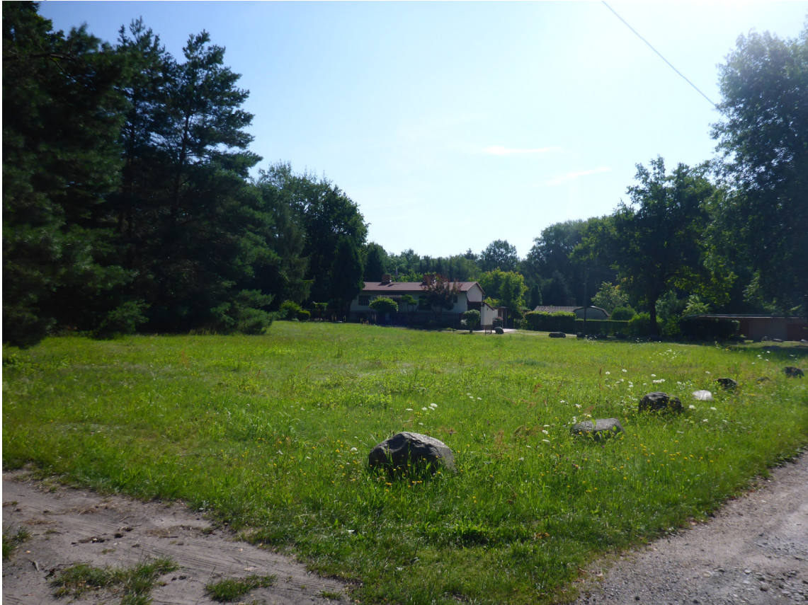
Abb.1 Blick auf die unbebaute nördliche Grundstücksfläche aus Sicht Schulze-Delitzsch-Str.