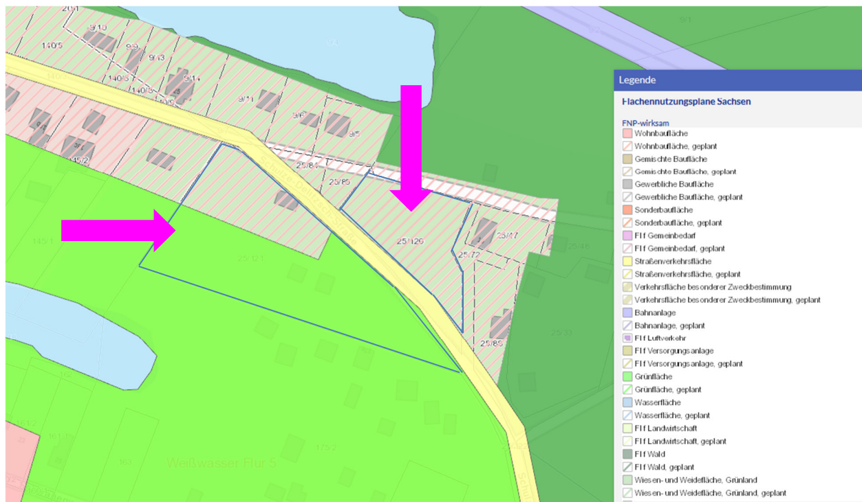
Auszug aus dem Flächennutzungsplan Weißwasser (Stand 2006) über Geoportal Sachsen

Bebauungsplan liegt nicht vor Flächennutzungsplan Nutzungsmöglichkeit als Wohnbau- und Grünfläche