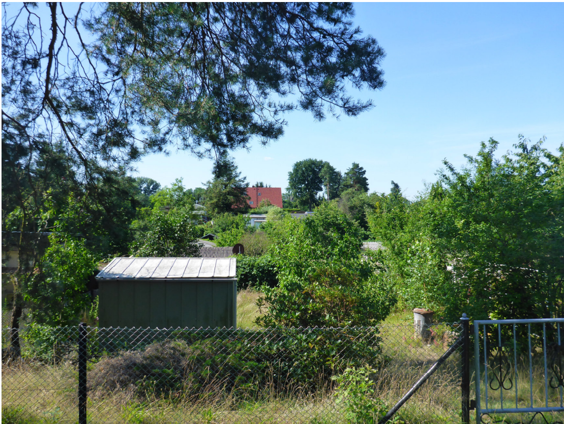
Abb.4 südliche Grundstücksfläche mit Lauben- und Garagenaufbauten