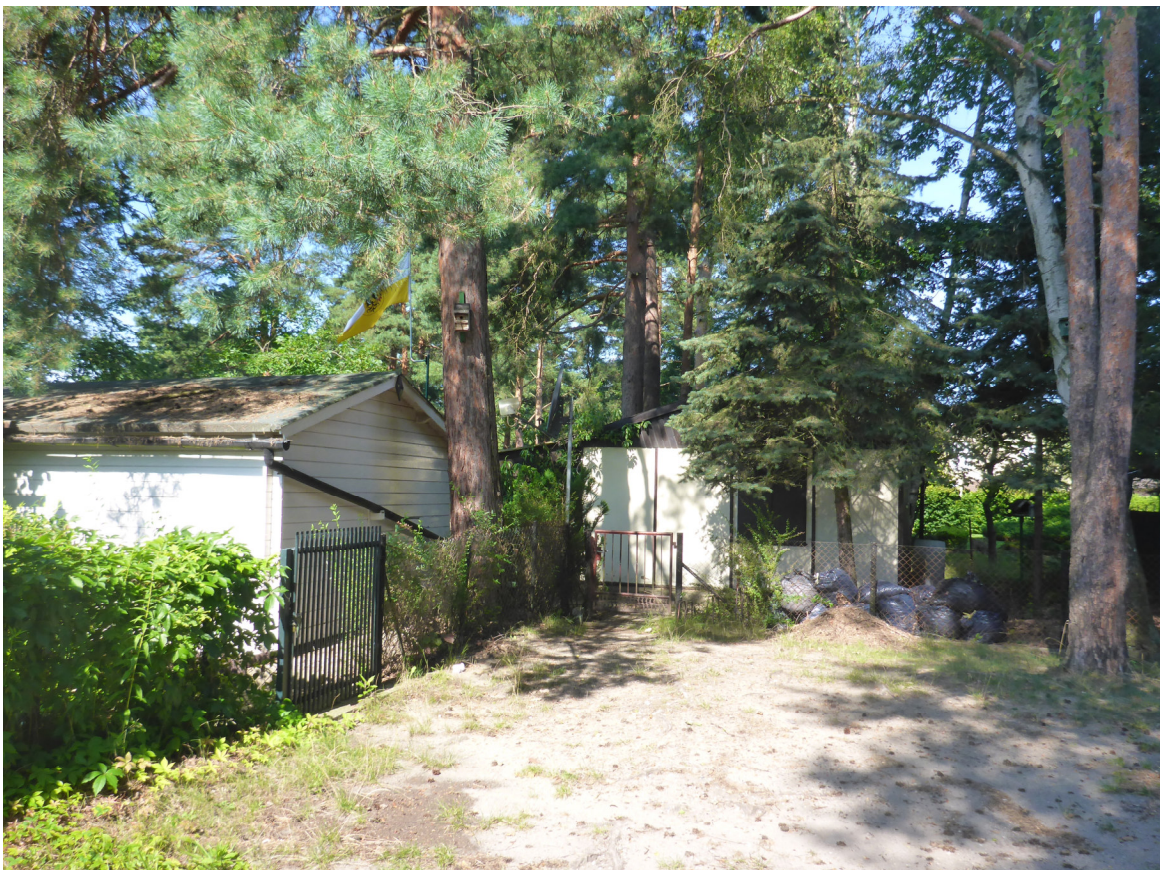
Abb.6 Weitere Lauben auf der südlichen Grundstücksfläche der Schulze-Delitzsch-Str.